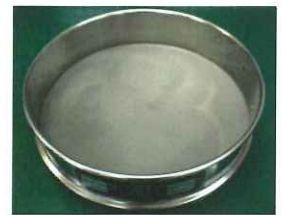
②シスト分離 篩受 水に浮遊し流れ出たシストを受けます。