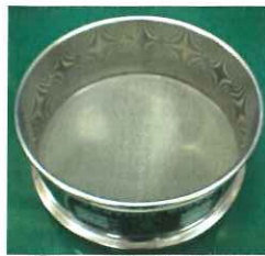
①シスト分離 篩 根や葉など大きな残渣を除きます。